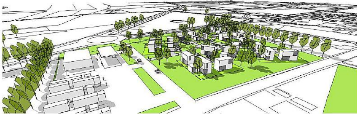
Højgaard Møller a/s | www.moller.dk | Øster Lindet Lokalråd | projektoplægning af et nyt fælles serviceområde i Øster Lindet